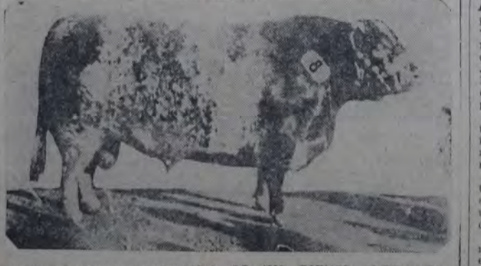
GRAN CAMPEON SHORTHORN DE 1929, ESTHER BLETCHLEY CHALLENGE.

En la forma sencilla y práctica que es de costumbre, se inauguró ayer en Palermo el certamen anual de la Sociedad Rural Argentina. También este año, como en los anteriores más inmediatos, nuestros hacendados y granjeros han sabido reunir en este certamen un número considerable de ejemplares que llaman la atención por su perfecto desarrollo y su alto grado de refinamiento.